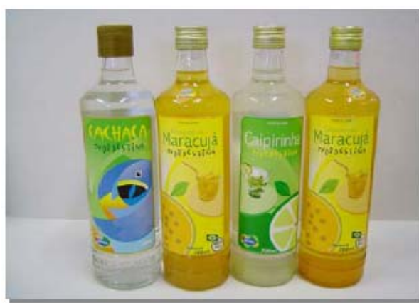
Figura 2: Produtos durante o processo de aprendizagem do executivo