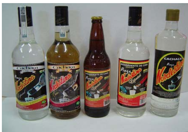
Figura 1: Produtos antes das modificações

Neste caso, o empresário refletiu sobre a sua competitividade no mercado internacional e de seus produtos, levando à melhoria de produtos. Nesta adequação da embalagem para o atendimento do mercado externo, foi realizado um trabalho junto ao SENAI de PE, que dispõe de um núcleo específico de design de embalagens tendo como base as experiências do empresário e da consultora do PSI, relatando as necessidades dos clientes internacionais. O resultado pode ser observado nas figuras 1 e 2 abaixo.